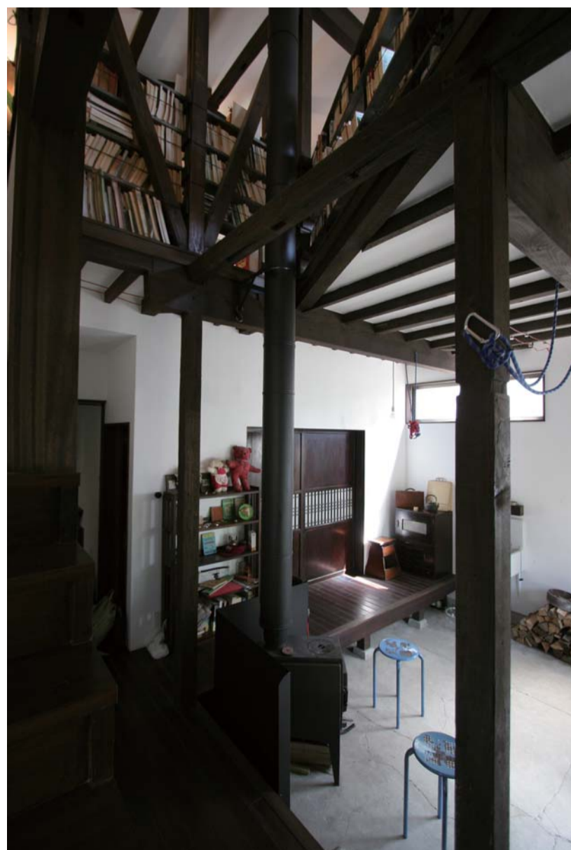
土間、吹抜け、内の縁側イメージ